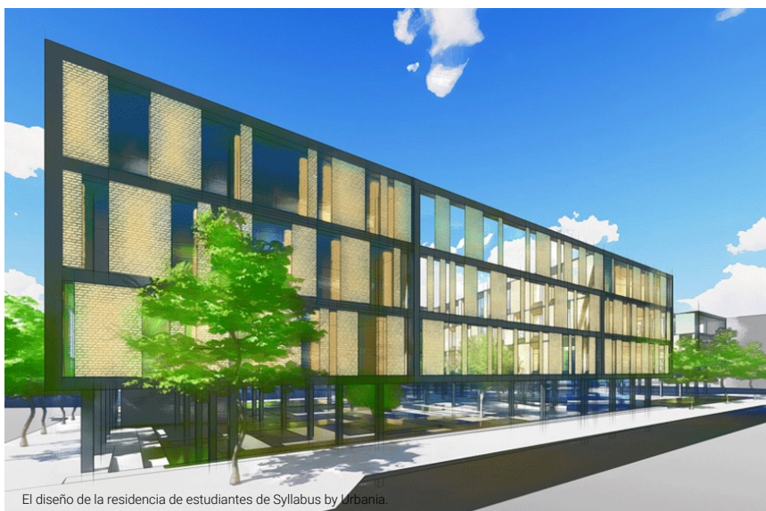
El diseño de la residencia de estudiantes de Syllabus by Urbania.

11.09.2019 · SALAMANCA (/SECCIONES/SALAMANCA/HOME) | FÉLIX OLIVA LÓPEZ | @FELIXOTWITTS