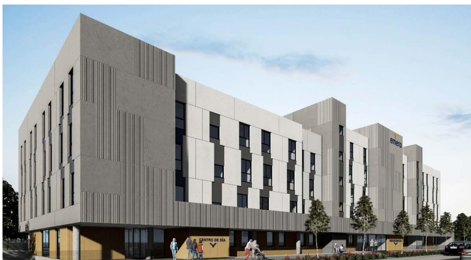
Recreación de la residencia de mayores El Cañaveral