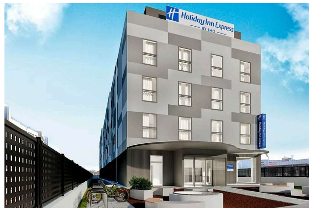
Proyecto en L'Hospitalet de Llobregat (Barcelona). EXPANSION

◆ Apollo, Cheyne y Tikehau inyectan 72 millones en Torraspapel y sanean el balance Lecta